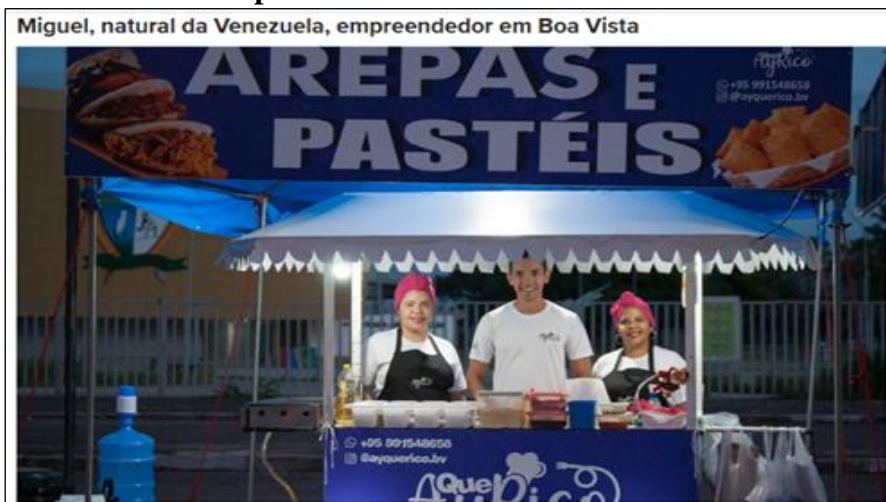
Figura 3 – Migrantes venezuelanos empreendendo em Boa Vista/RR

venezuelanas como pepitos, cachapas e arepas, mudando assim a visualidade da Amazônia Brasileira. Profissionais foram contratados nesses estabelecimentos para trabalhar, aumentando sua renda e fomentando o compartilhamento de saberes culinários venezuelanos nesses espaços. Assim, a população local de Boa Vista pode acessar elementos culturais do país vizinho.