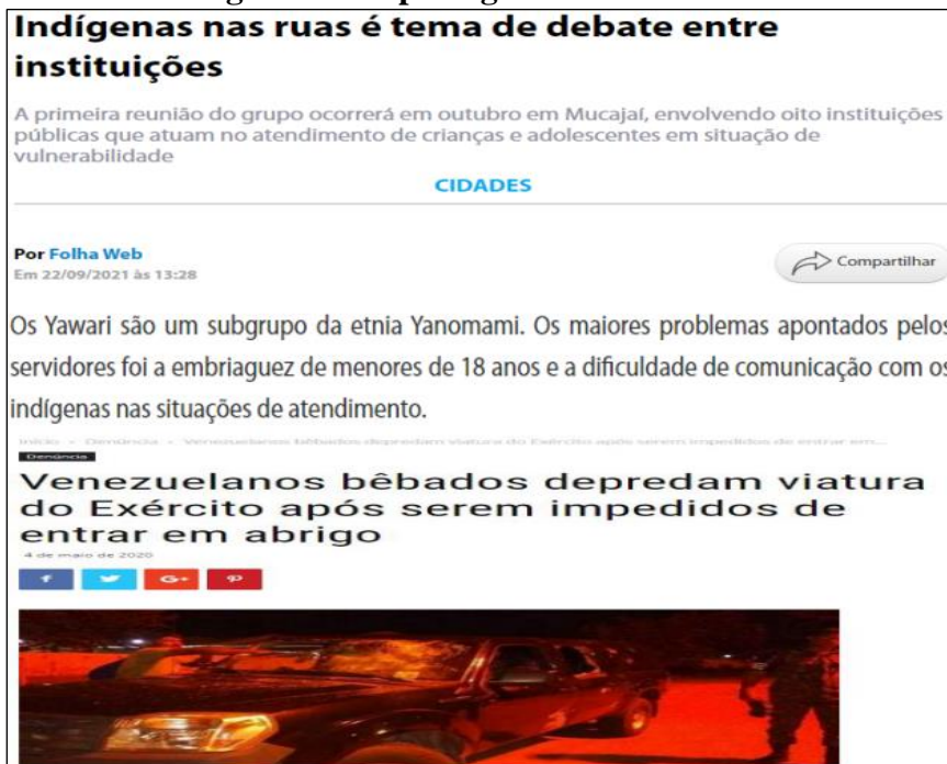
Figura 2 – Reportagens da mídia local

busca por serviços médicos especializados por este público. Conforme ilustram as manchetes: