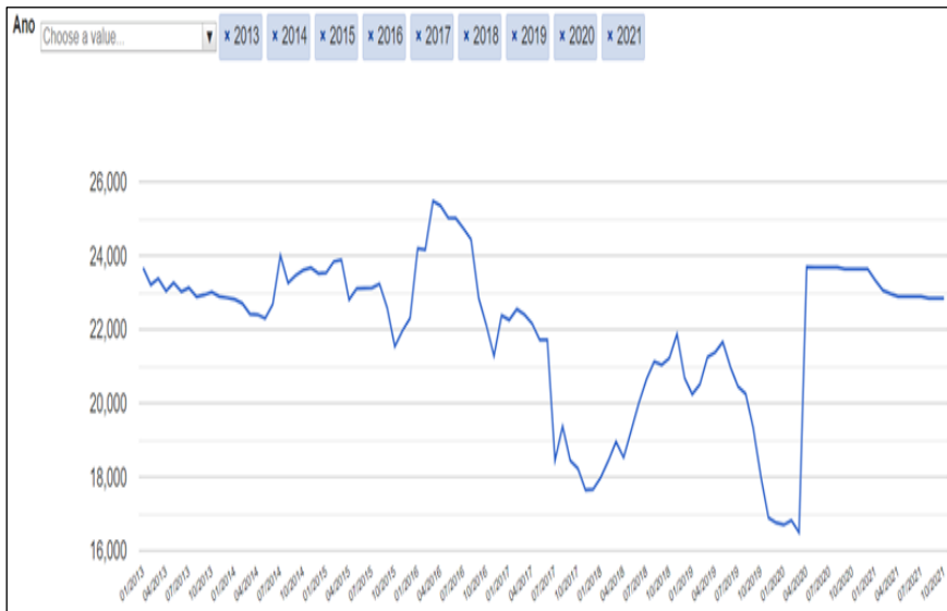
Gráfico 1 – Famílias beneficiadas do Bolsa Família

Após o fenômeno da migração venezuelana, muitos fatos passaram a ocorrer. Sabe-se que no aspecto socioeconômico, por exemplo, houve um impacto nos programas sociais no estado de Roraima que são vinculados à frequência escolar, conforme tabela abaixo da Secretaria Nacional de Renda de Cidadania (SENARC).